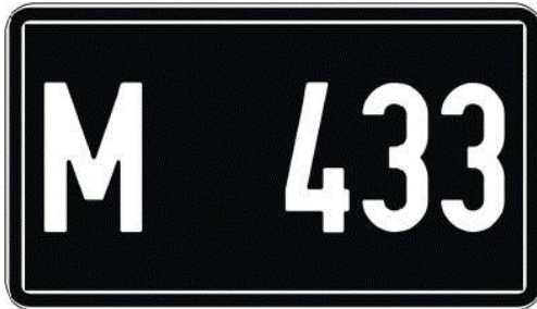
Vanasõiduki (mootorratas, mopeed, maastikusõiduk) ja selle haagise registreerimismärk. Kirja tüüp: 3.

Tüüp B2, 177×101 mm. Registreerimismärki kasutatakse mootorratastel, mopeedidel, maastikusõidukitel ja nende haagistel.