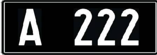
Tüüp A9. Vanasõiduki ja selle haagise registreerimismärk. Kirja tüüp: 4.

Tüüp A9, mõõtmetega 302x113 mm. Registreerimismärke kasutatakse autodel (sõiduauto, veoauto, buss jne) ning nende haagistel.